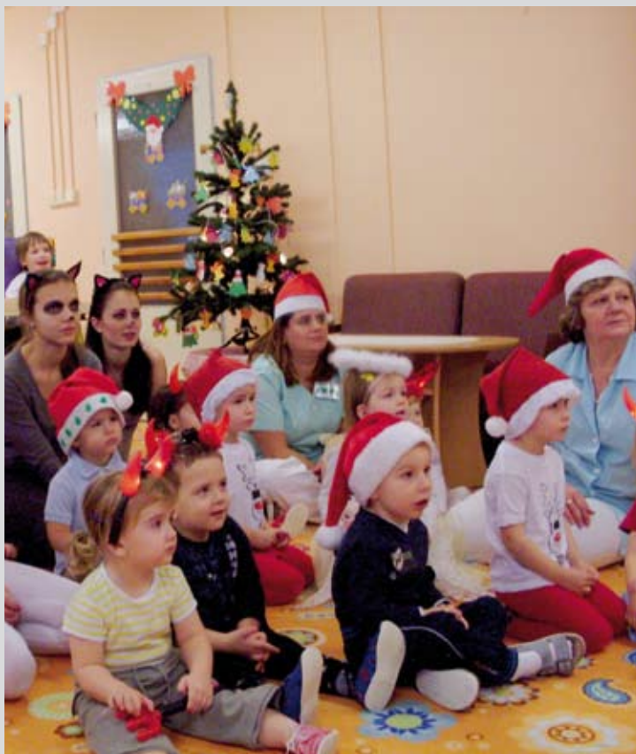
Lazariánská pomocná služba finančně a materiálně zajistila svatomikulášskou nadílku dětem v Denním dětském rehabilitačním stacionáři a ve Středisku denní péče v Mostě.

(Handwritten signatures of children and their parents)